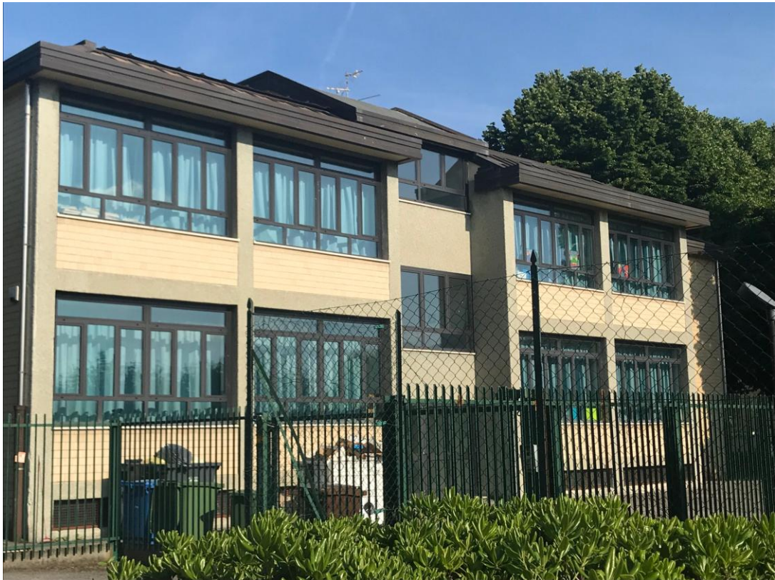
Foto 1: Vista esterna della scuola